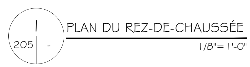
PLAN DU REZ-DE-CHAUSSÉE 1/8" = 1'-0"